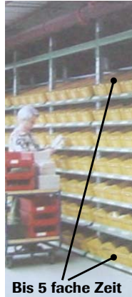
Bis 5 fache Zeit